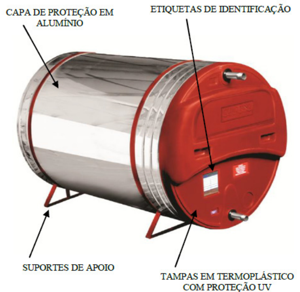
Vista Externa do Reservatório